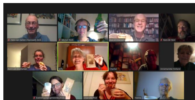
Foto: deelnemers online nazit. Met dank voor de waardevolle inbreng.

Het duurzame café – afsluiten en napraten met alle organisatoren – kon ook geen doorgang vinden. In plaats daarvan hebben we een online nazit georganiseerd met een enthousiaste groep deelnemers.